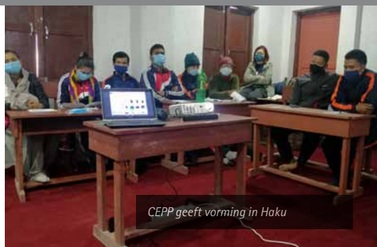
CEPP geeft vorming in Haku