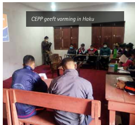
CEPP geeft vorming in Haku