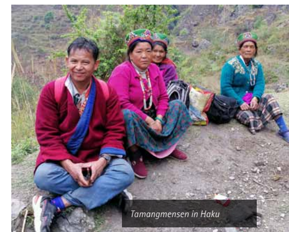
Tamangmensen in Haku

Voor meer foto's en filmpjes kun je terecht op onze website: https://bikas.org/haku