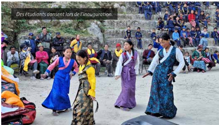
Des étudiants dansent lors de l'inauguration.