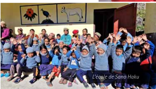
L'école de Sano Haku

Il est encourageant de voir ce qui a déjà été réalisé à Haku. Le processus de construction est derrière nous et nous nous concentrons maintenant sur le contenu de l'enseignement. Avec le personnel du CEPP, le travail est maintenant en cours pour améliorer l'enseignement primaire dans un environnement sûr, convivial et adapté aux enfants. Progressivement, une prise