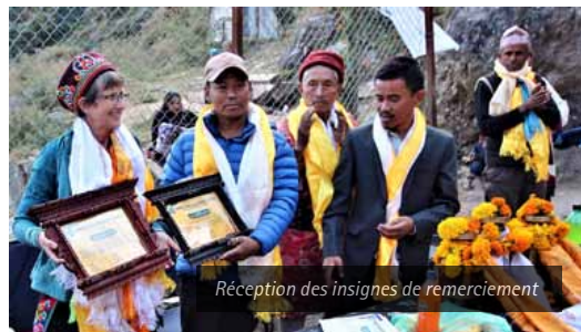
Réception des insignes de remerciement