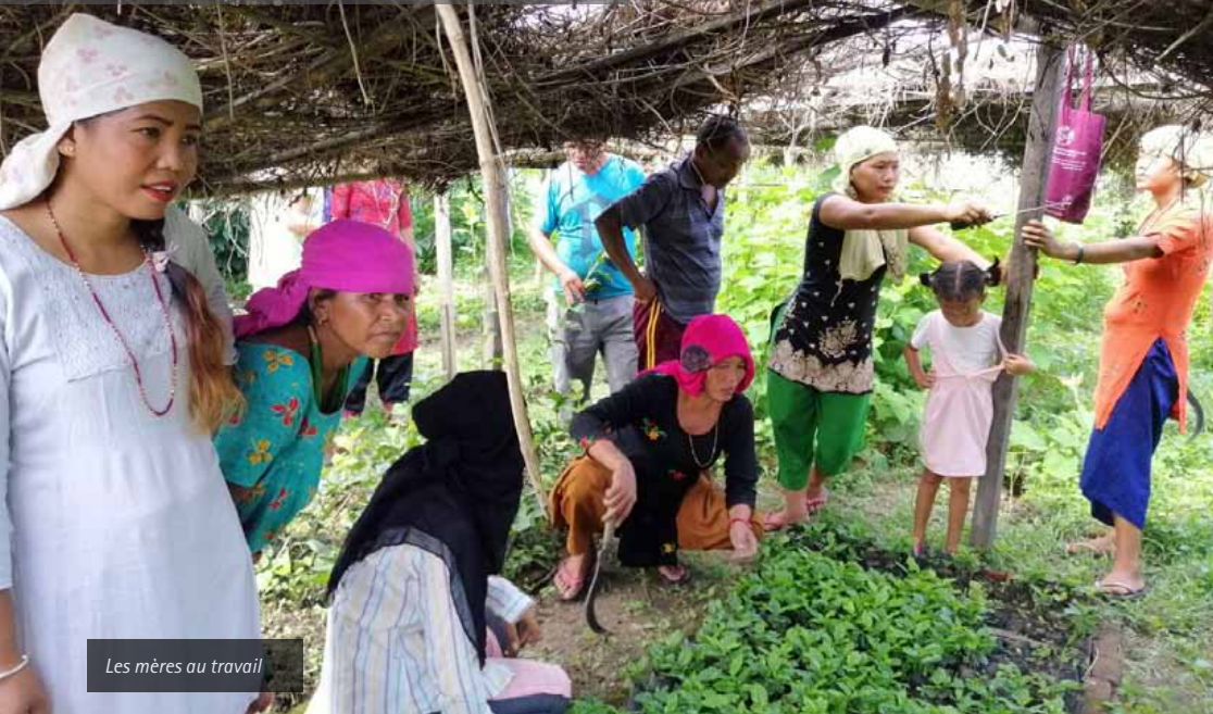
Les mères au travail