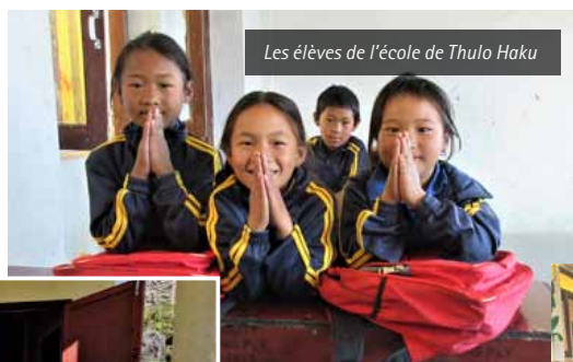
Les élèves de l'école de Thulo Haku