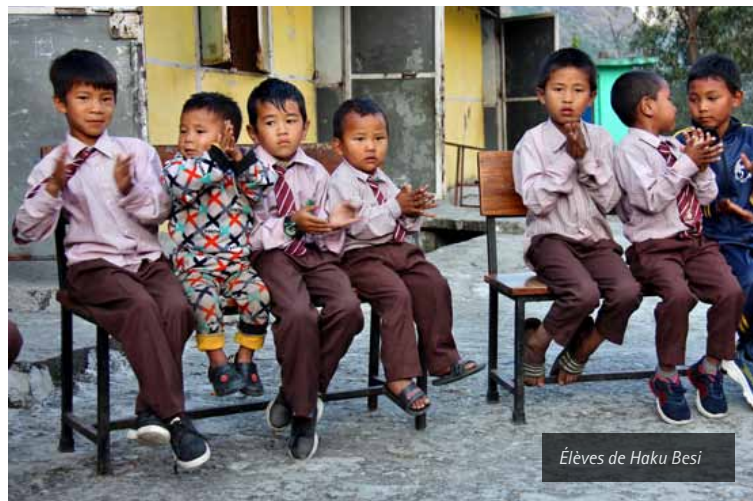
Élèves de Haku Besi

L'emplacement des parcelles expérimentales près des écoles crée un échange d'informations. Les élèves suivent les processus des pépinières. Ils reçoivent un enseignement dans les champs d'essai, aident à la culture, voient tout pousser et, le moment venu, ils récoltent et goûtent ce qu'ils ont semé eux-mêmes.