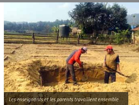
Les enseignants et les parents travaillent ensemble

Dans l'image ci-dessous, nous voyons les mères au travail. Une motivation supplémentaire est qu'elles sont également autorisées à emporter certains des jeunes plants chez eux, créant ainsi leur