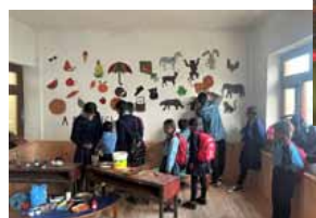
Salle de classe à Thulo Haku