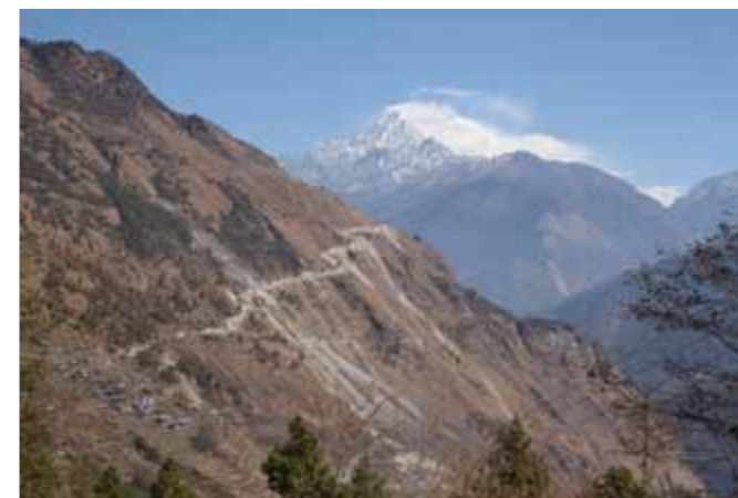
De erosie in het gebied is opvallend, net als de hydro-elektrische installatie op de rivier en de nieuwe weg in aanbouw.