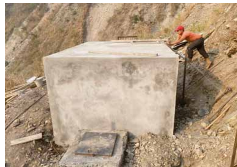
Werken aan de watertank van 10 m 3 in Bongrel Dada