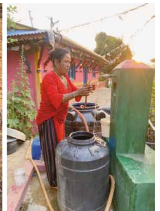
Zo was het vroeger.