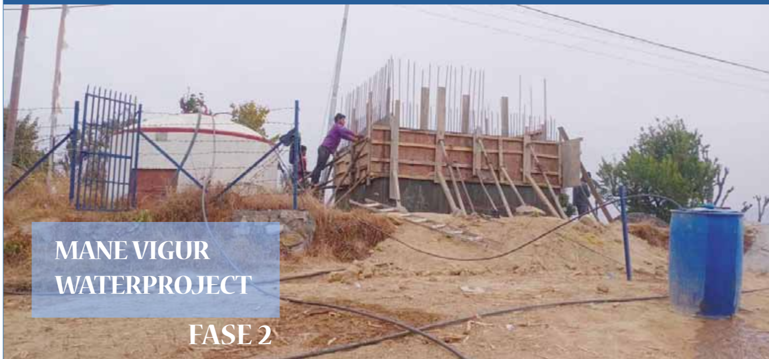
Mane Gaou, werken aan de grote watertank van 50 m 3

Half maart kregen we het bericht dat twee van de voorziene watertanks volledig geïnstalleerd waren, de grootste van 50 m 3 in Mana Gaou en deze van 20 m 3 in Bhimkhora Dada.