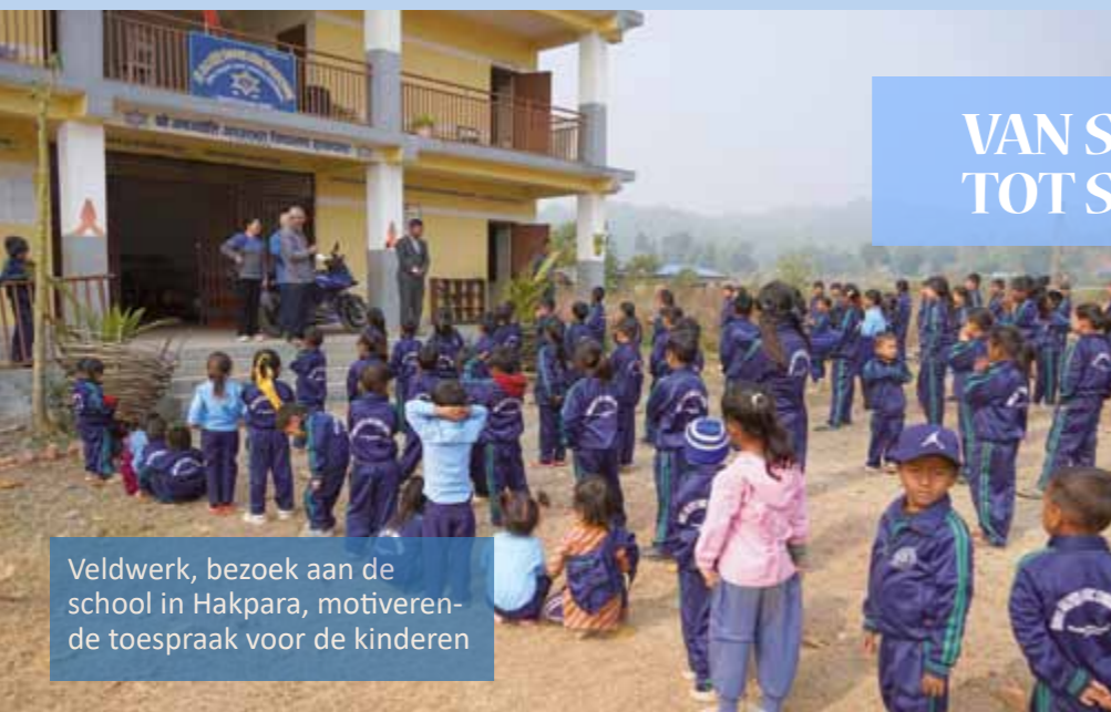
Veldwerk, bezoek aan de school in Hakpara, motiveren de toespraak voor de kinderen